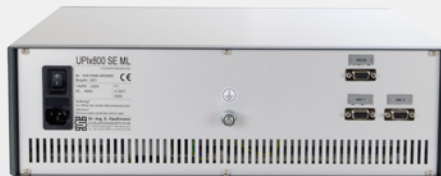
Tischgehäuse mit MicroLabBox®